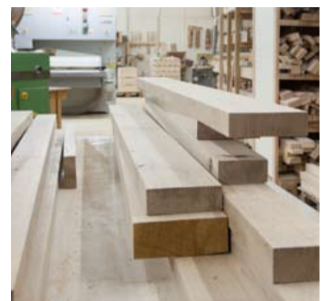
Massivholzbearbeitung in Scharnstein

MASSIVHOLZ IST UNSERE STÄRKE! SEIT VIER GENERATIONEN ARBEITEN WIR DAMIT. SPANPLATTEN? KENNEN WIR NUR AUS ERZÄHLUNGEN.