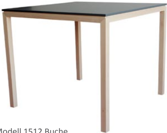
Modell 1512 Buche