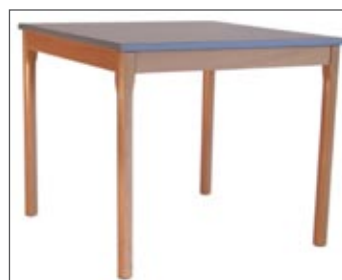
Modell 1400 mit Ausnehmungen im Zargenrahmen