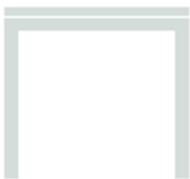
VIERFUSS MIT ZARGE