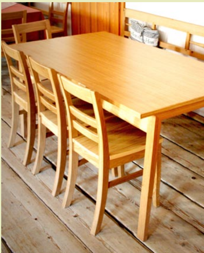
Gasthaus Silmbroth - Modell 1515