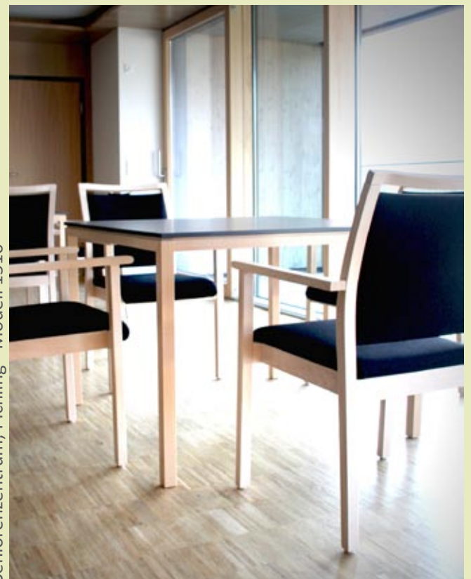
Seniorenzentrum, Pichling - Modell 1510