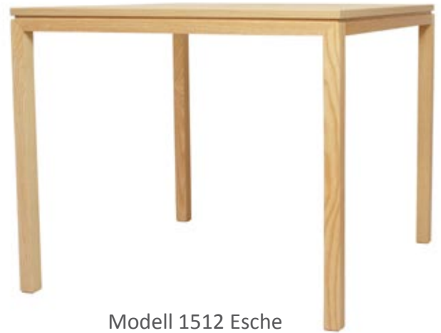
Modell 1512 Esche