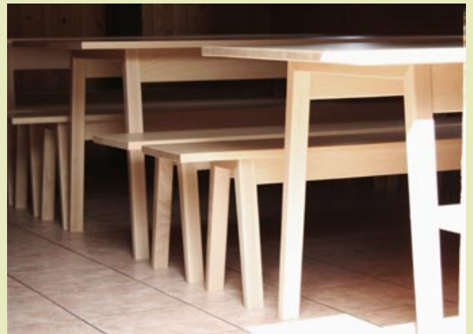
Agapitusheim, Grünau - Modell 1510